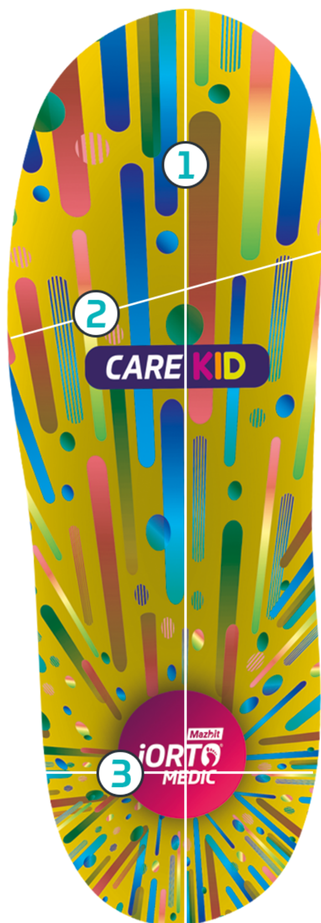
TABELA ROZMIARÓW PRODUKTU CARE KID (STANDARD)