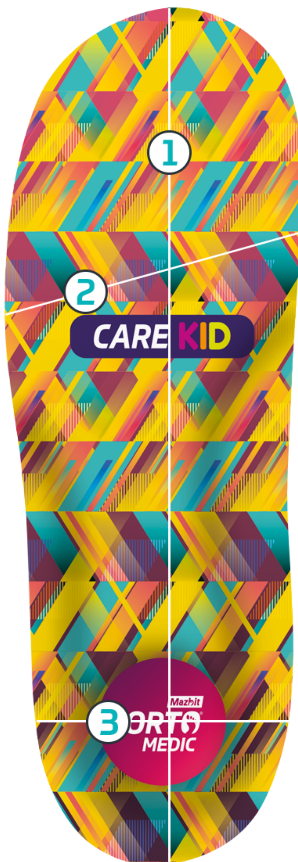
TABELA ROZMIARÓW PRODUKTU CARE KID (SPACE)